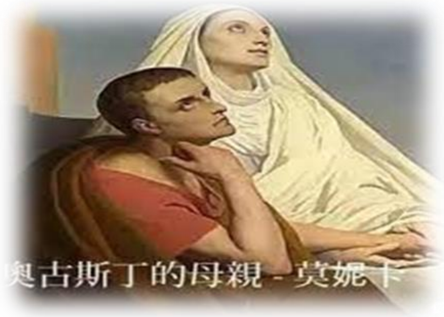
奥古斯丁的母亲 - 莫妮卡

罗马书7章24 我真是苦啊！谁能救我脱离这取死的身體呢？25感谢 神！靠着我们的主耶稣基督就能脱离了。